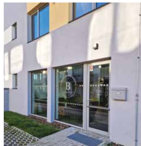
Pronajatý nebytový prostor

Mezi významné investiční výdaje patří úhrada poslední splátky nebytového prostoru v ulici Pastevců ve výši 3 801 820 Kč, přičemž celkové náklady včetně venkovních parkovacích stání činí částku ve výši 10 246 029 Kč. Městská část tento prostor pronajala a od srpna letošního roku je zde v provozu Bistrotéka, kde si v příjemném prostředí můžete dát něco dobrého. Na údržbu zeleně jsme zatím vynaložili 392 000