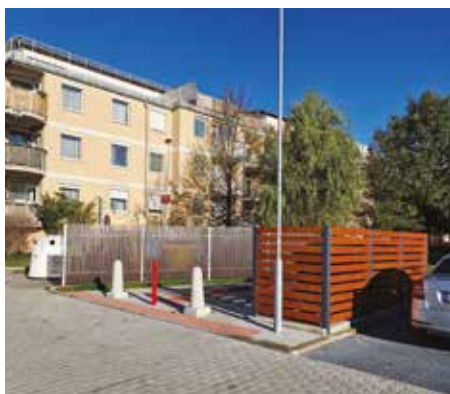
Oplocené stání separovaného odpadu v ulici Pastevců

Ze státního rozpočtu jsme získali na volby prezidenta 130 000 Kč.