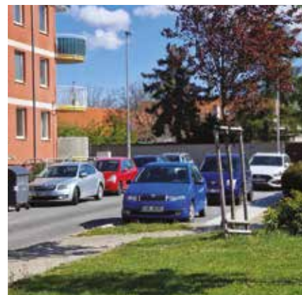
Nová parkovací místa v ulici Remízková