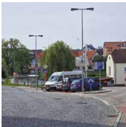
Úprava parkoviště na náměstí v Újezdu