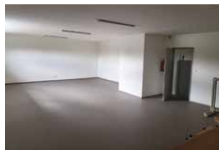
Nový prostor v hasičské zbrojnici

ve výši 5 000 000 Kč na rekonstrukci ulice Proutěná. Tyto prostředky budou použity na úpravu parkovišť za domem Proutěná č. p. 418–422 a v ulici U Pramene. Další dotace ve výši 300 000 Kč je určena na regeneraci a údržbu zeleně na Miličovských kopcích a bude čerpána na podzim letošního roku. Na vestavbu stropu hasičské zbrojnice v ulici Nad Statkem byla použita dotace ve výši 1 144 000 Kč. Základní škole Formanská byly zaslány finanční prostředky ve výši 28 000 Kč z dotace na prevenci rizikového chování a 50 000 Kč určené na prožitkovou pedagogiku a projektové prvky do výuky angličtiny.