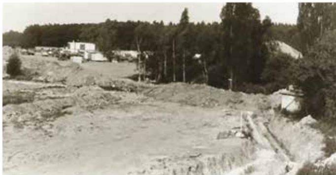
Budoucí sídliště Kateřinky – 80. léta

Sledovali jsme, jak na polích kolem Chodova a Hájů se objevuje asfaltová silnice odnikud nikam, různé rozvody inženýrských sítí odtud tam, hromady hlíny, výkopy pro kolektory. Jak nám bylo vysvětleno, nebude Jižní Město opakovat chyby ostatních sídlišť, kde se staví domy a potom teprve silnice a chodníky. Zde se budou stavět domy k hotovým chodníkům do připravených ulic, mezi připravené parky k připraveným obchodům. Úmysl byl asi dobrý, jenom se to nepovedlo. Silnice se brzy ztrácely v blátě, tráva a stromky nevydržely stavební a dopravní ruch, obchody a školy nebyly postaveny ještě ani po nastěhování obyvatel do nových domů. Děti přijala chodovská škola, kde se učilo na směny. Nákupy si vozili obyvatelé z centra. Někteří využívali masnu a zeleninu v Chodově. Oba tyto obchody se pro Pražany, i ty zde nebydlící, stávaly známým pojmem, proto-