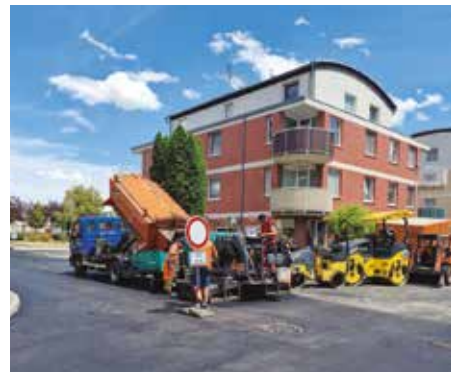
Oprava ulice Remízková

ni - peníze byly zaslány na účet ZŠ Formanská,