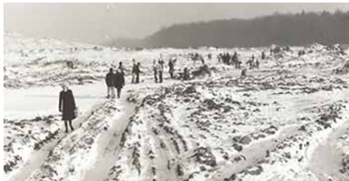
Budoucí ulice Proutěná – 80. léta

Přesto, že byl Motel v blízkém sousedství Újezda, nijak se vzájemně neovlivňovaly. Pouze někdy do Újezda chodili na vycházku hoteloví hosté. Někdy, zřejmě omylem, byl do Motelu poslán host, který nejel po dálnici, ale autobusem přijel do Újezda a s papírkem s adresou v dlaní nevěděl, jak se na místo dostat. I ve dne pro české hosty nebyla cesta do Motelu jasná, protože byla vidět jen pole a v dále les. Cizinci to řešili většinou tak, že hlavně večer zazvonili u posledního