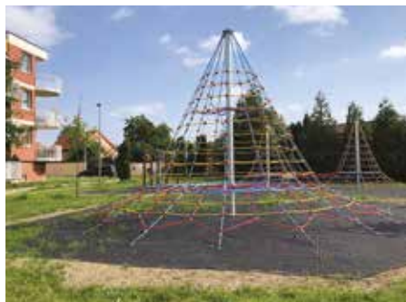
Lanový park hrazený z dotace

Nyní probíhá akce Revitalizace Návesního rybníku. Dotace pro Sbor dobrovolných hasičů jsou téměř vyčerpány. Akce Lanový park je již ukončena a dotace vyčerpána, stejně tak jako dotace určená na akci Den bez aut, která již proběhla v září tohoto roku.