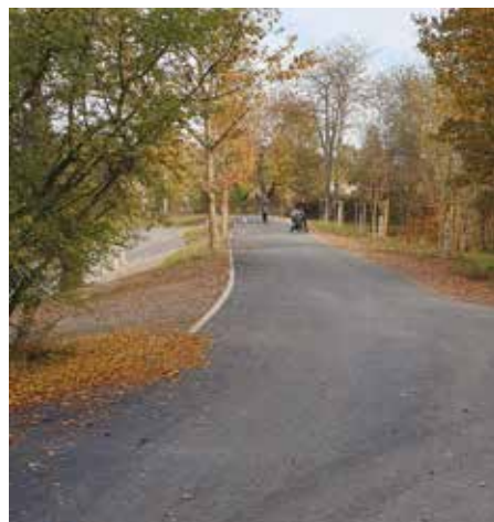
Opravená cesta u Miličovského rybníku