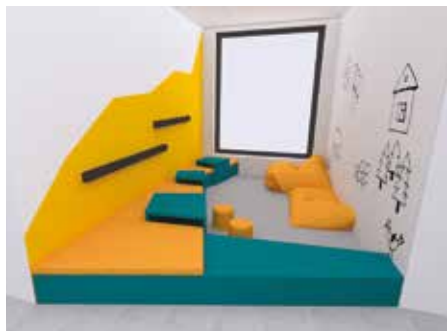
Dovybavení ZŠ Formanská – relaxační koutek pro děti

Dotace na výstavbu Základní školy Formanská pro 1.–5. stupeň nebyla dočerpána, a proto jsme požádali o převod zbylých finančních prostředků na zpracování studie stavby a projektové dokumentace Základní školy Formanská 1. a 2. stupeň.