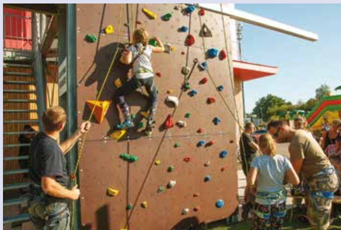
Lezecká stěna na hasičské zbrojnici