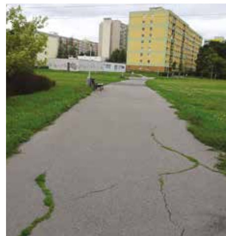
Chodník spojující sídliště Kateřinky a Jižní Město