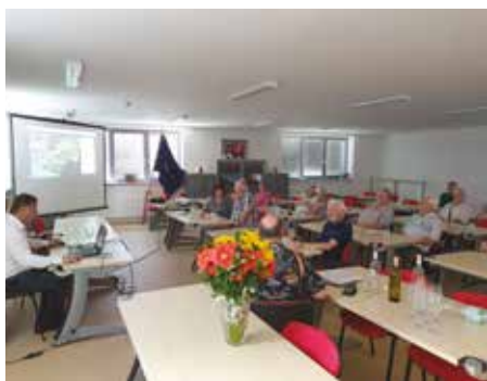
Setkání se seniory ve společenské místnosti hasičské zbrojnice

V letošním roce se podařilo dokončit a rozpracovat několik investičních akcí. Začátkem roku byla zkolaudována zbrusu nová hasičská zbrojnice. Její prostory využívá Sbor dobrovolných hasičů Praha-Újezd a Technické služby Újezd, s.r.o. Městská část v prostornější společenské místnosti hasičské zbrojnice pořádá zasedání zastupitelstva, setkávání se seniory a s veřejností. Tento prostor byl poprvé v listopadu využit pro vítání našich nových spoluobčánek.