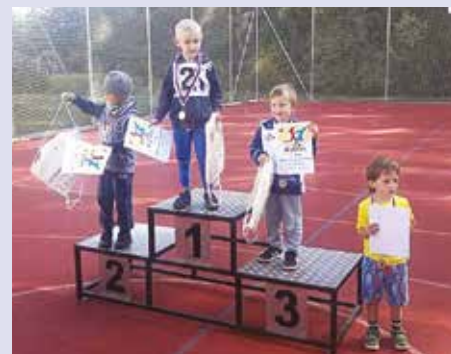
Vítězové jedné z kategorií běžeckých závodů

Letošní podzimní běžecké závody se původně měly konat v sobotu 12. října, ale vzhledem k vyhlášenému státnímu smutku byl termín posunut na neděli 13. října. Závodů se aktivně zúčastnilo 52 dětí a 15 dospělých. Celý den nás provázelo krásné slunečné počasí, které závodníkům dodáva-