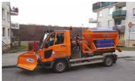
Multikára s výbavou na úklid sněhu

Pro potřeby zimní údržby je městská část rozdělena do čtyř částí: „Kateřinky původní zástavba a Na Formance“, „Viladomy v Kate-