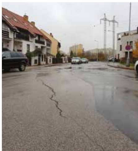
Komunikace v ulici Proutěná

byla schopna uspokojit aktuální poptávku po umístění dětí do mateřinky. Pokud vše půjde podle plánů a v roce 2023 zahájíme provoz v nové základní devítileté škole, tak volné prostory po základní škole prvního