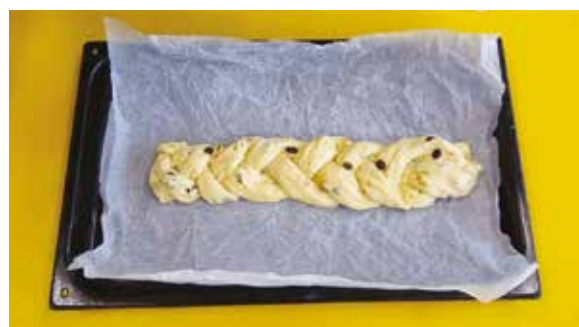
Příprava na Vánoce

Během adventu si ve školce ozdobíme stromeček a rozsvítíme ho snad tisícem světýlek, aby ho našel náš „školkový Ježíšek“, přinese nám nové hračky do tříd, nové didaktické pomůcky a také další vybavení. Letos možná i nové žebříky do tělocvičny. Můžete nám na ně přispět koupí vánočních dekorací na stánku mateřské školy na slavnosti Rozsvícení vánočních stromů.