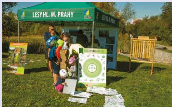
Prezentace Lesů hl. m. Prahy