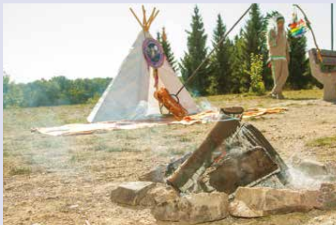
Indiánské tábořiště na Milíčovských kopcích