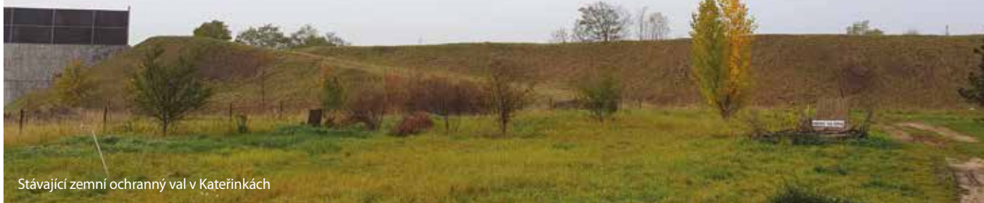
Stávající zemní ochranný val v Kateřinkách