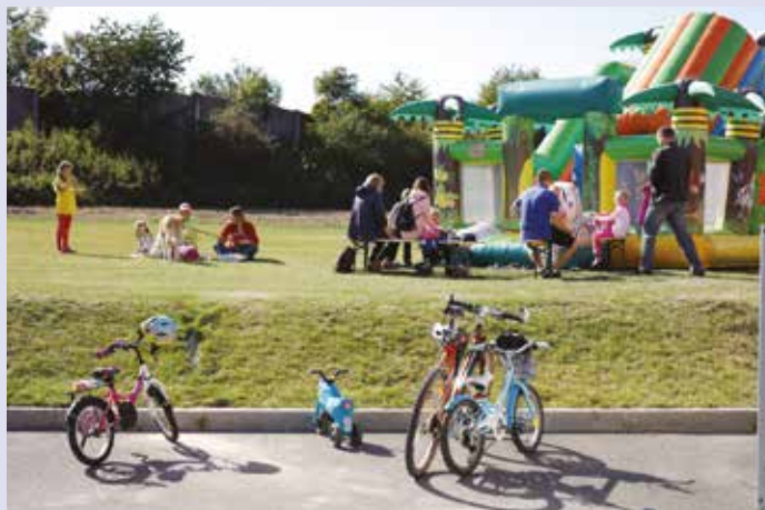
Skákací hrad v Újezdu