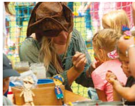
Oslava dětského dne

Již v únoru roztančily celou městskou část masky v tradičním masopustním průvodu. Další akcí bylo březnové vynášení Morany. Podle krásného jara a léta jsme zimu zahnali skutečně dokonale. Jaro dále pokračovalo běžeckými závody pro děti a dospělé, pálením čarodějnic, stavěním májky, kácením májky a májovou veselí. Léto jsme začali pořádáním dětského dne spojeného s fotbalovým turnajem a pivními slavnostmi. Tato akce je tradičně poslední akcí před prázdninami.