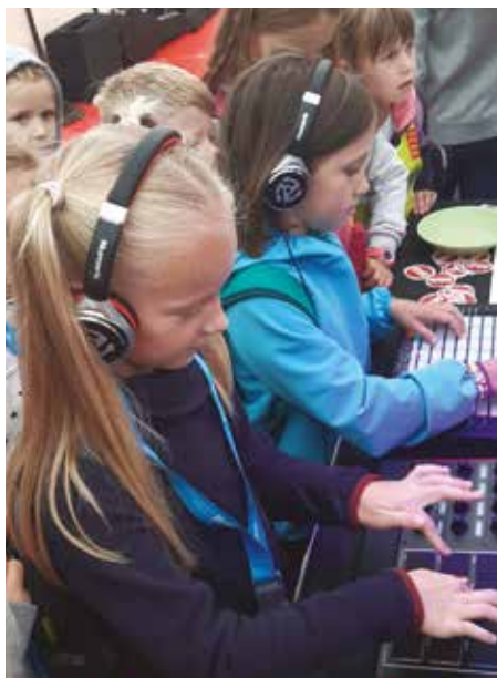
Děti ze základní školy na hudební akci Festiwall

Začátky jsou vždy plné očekávání z nového, ještě nepoznaného. Věříme, že se nám podaří naše děti zaujmout a otevřít jim nové obzory, které budou moci plně využít pro sebe a své okolí.