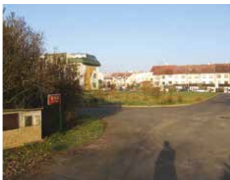
Ulice Vodnická z ulice Na Křtině – 2007

V dnešním čísle zpravodaje se vracíme k představování míst z naší městské části, která v posledních letech doznala velkých změn.