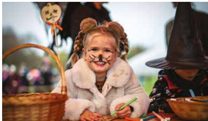
Halloween v Újezdu

Každoročně začínáme masopustním průvodem mířícím z Kateřinek do Újezdu, který byl v letošním roce zakončen masopustní zábavou. Vynášení Morany a vítání jara je vždy předzvěst toho, že nastává čas pálení čarodějnic a stavění májů. Tyto tradice, i když s různými obměnami, se v naší městské části udržují již více jak 20 let. Pak už přichází čas akcí, na které se nejvíce těší děti – dětský a sportovní den. Podzim je ve znamení podzimních slavností, které