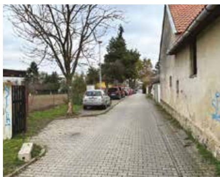
Ulice Milíčovská – 2024