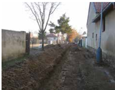
Rekonstrukce ulice Milíčovská – 2007