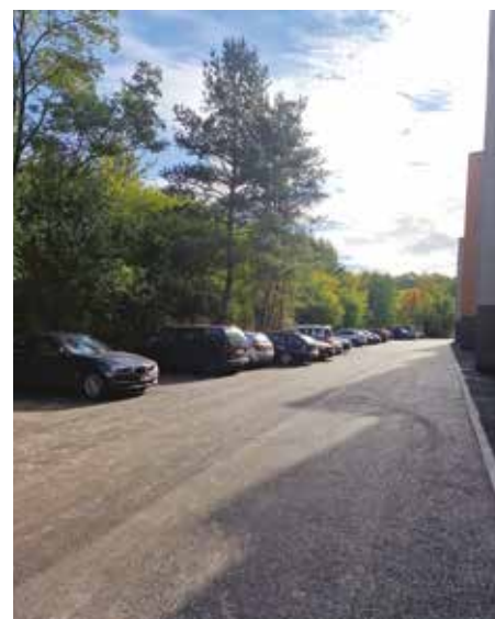
Parkoviště za bytovým domem Proutěná 418-421