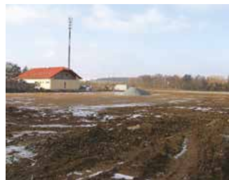
Výstavba fotbalového hřiště – 2009