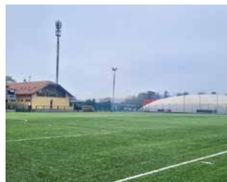
Fotbalové hřiště – 2024