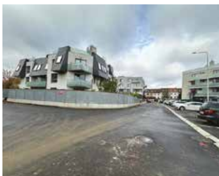
Ulice Vodnická z ulice Na Křtině – 2024