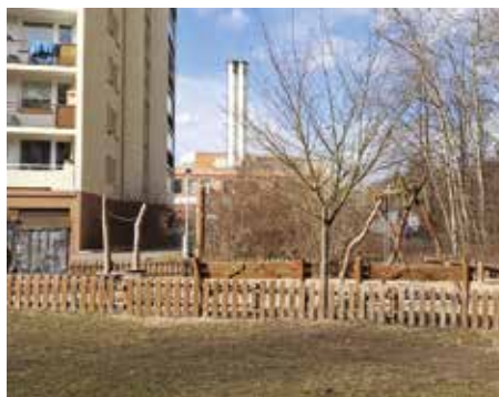
Ulice Vodnická – 2025