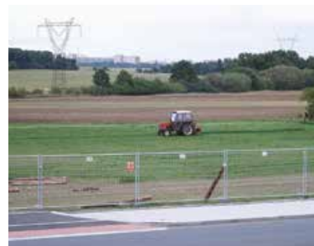
Budoucí ulice Na Vojtěšce – 2015