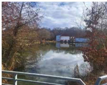
Koničkův mlýn s rybníkem – 2025