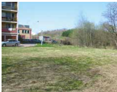
Ulice Vodnická – 2005

V dnešním čísle zpravodaje se vracíme k představování míst z naší městské části, která v posledních letech doznala velkých změn.