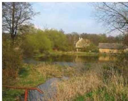
Koničkův mlýn s rybníkem – 2005