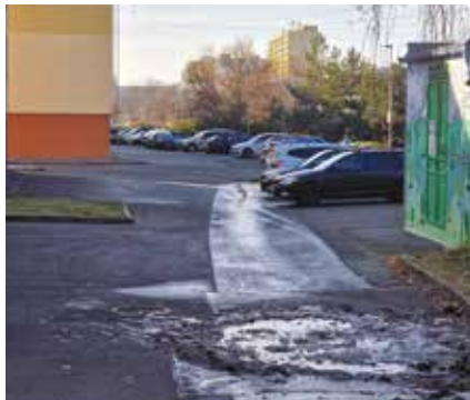
Zadní trakt za ulicí Proutěná 400-410 před rekonstrukcí

V rámci finančního vypořádání dotací z hl. m. Prahy jsme požádali o ponechání nevyčerpaných prostředků v roce 2024 z dotace pro JSDH ve výši 61 000 Kč a dále z dotace na rekonstrukci ulice Milíčovská ve výši 5 184 000 Kč. Současně jsme předložili žádost o přiznání dotace ve výši 10 000 000 Kč