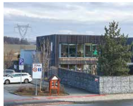
Ulice Na Vojtěšce – 2025