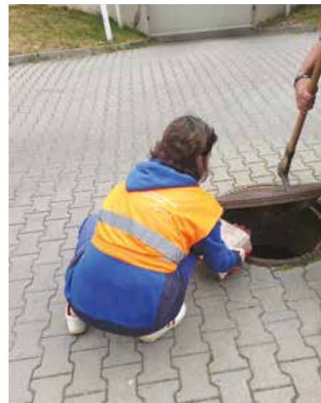
Deratizace kanalizační sítě v ulici Pastevců