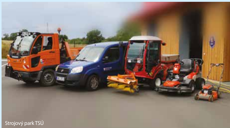
Strojový park TSÚ