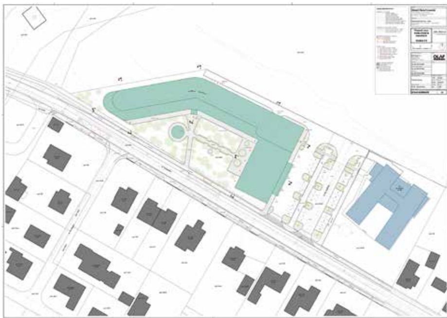
Situace ZŠ Formanská, 1. a 2. stupeň

Stávající prostory základní školy 1. stupně budou po zprovoznění nové základní školy