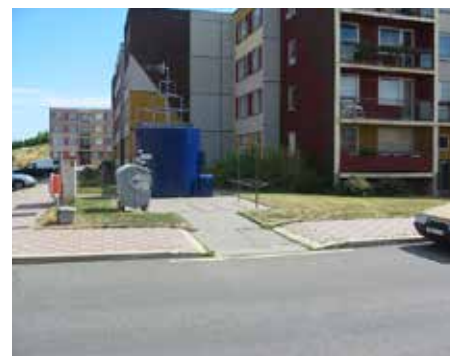
Ulice Proutěná x U Pramene, Kateřinky – 2004