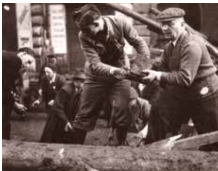
Stavění barikád v květnu 1945

Přesto, že je Újezd na okraji Prahy, válečné události se nás bezprostředně nedotýkaly. Těžké boje konce války se odehrávaly na dohled. V Chodově, kde ve škole byli ubytováni vojáci, v Uhříněvsi kolem nádraží, v Kunraticích na výpadovce do Benešova. Každý, kdo dojížděl nebo docházel za prací mimo obec, přinášel zprávy o dění v okolí, ale tady se dál selo a sklízelo obilí, vychovávaly se děti. Němečtí vojáci se objevovali jako kontroly a většinou zase bez velkého rozruchu odešli. Skupina asi 50 německých vojáků chodila z Průhonic do Milíčova