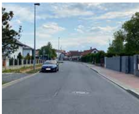
Ulice Josefa Bíbrdlíka, Újezd – 2022