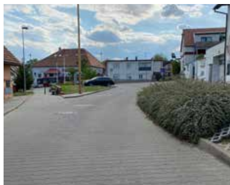
Náměstí Újezd – 2022