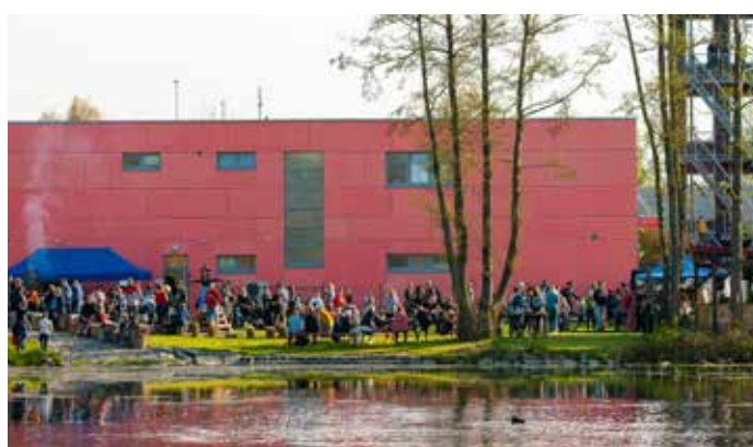
Pálení čarodějnic u hasičské zbrojnice

Přesunutí sportovních a kulturních akcí k hasičské zbrojnici má několik výhod. Všechny akce pořádá městská část společně s do-