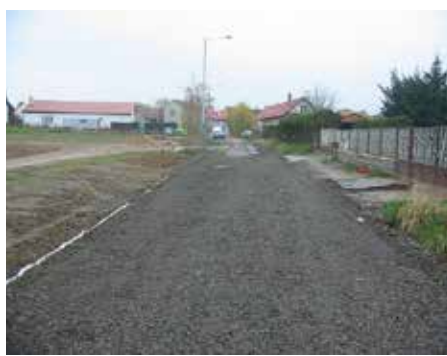
Ulice Josefa Bíbrdlíka, Újezd – 2004