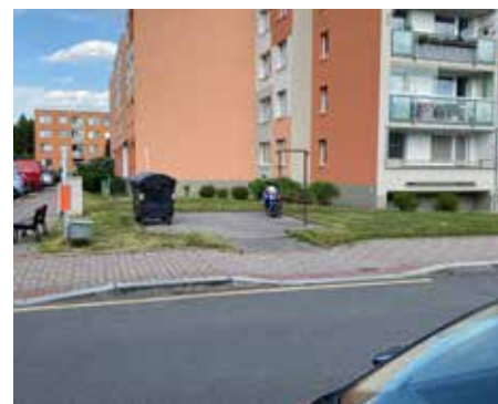
Ulice Proutěná x U Pramene, Kateřinky – 2022

I nadále bychom chtěli v této rubrice pokračovat, proto vás prosíme o zapůjčení vašich historických fotografií Újezdu nebo Kateřinek. Děkujeme.