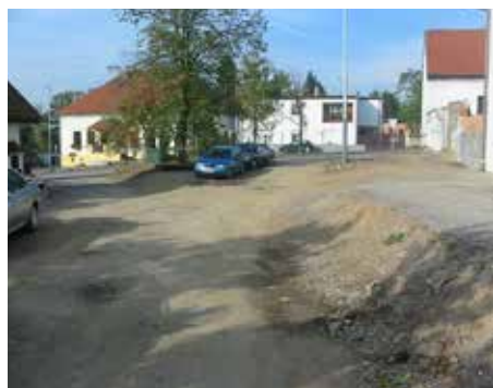
Náměstí Újezd – 2003

V dnešním čísle zpravodaje pokračujeme v představování míst z naší městské části, která v posledních letech doznala velkých změn.