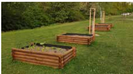
Komunitní záhony v ulici Pastevců