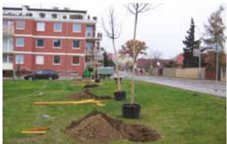
Kateřinské náměstí – 2005

V dnešním čísle zpravodaje pokračujeme v představování míst z naší městské části, která v posledních letech doznala velkých změn.