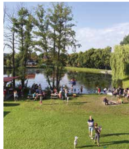
Oslava ukončení školního roku mateřské školy