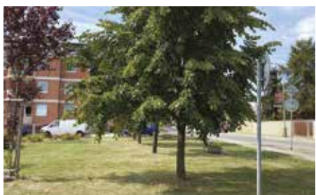
Kateřinské náměstí – 2022