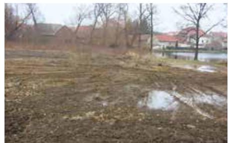
Návesní rybník – 2004