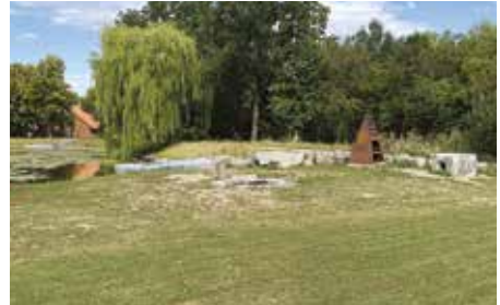
Návesní rybník – 2022

I nadále bychom chtěli v této rubrice pokračovat, proto vás prosíme o zapůjčení vašich historických fotografií Újezdu nebo Kateřinek. Děkujeme. Redakční rada (e-mail: info@praha-ujezd.cz ; tel: 272 690 692)