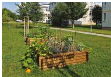
Komunitní záhonky již slouží svému účelu