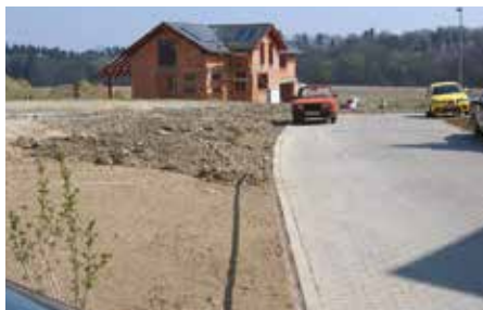
Ke Mlýnu – 2007