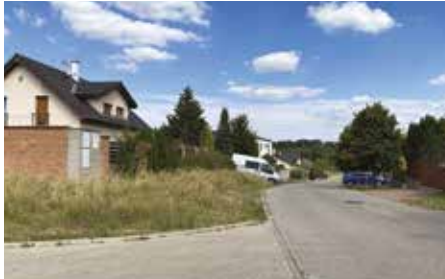
Ke Mlýnu – 2022