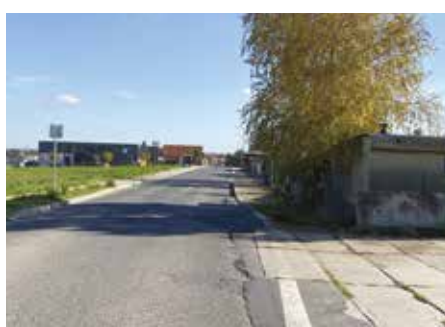
Formanská, Újezd – 2022