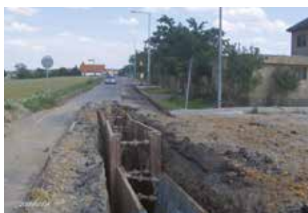
Formanská, Újezd – 2005