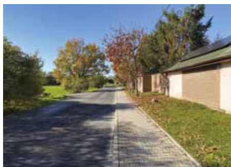
Formanská, Kateřinky – 2022