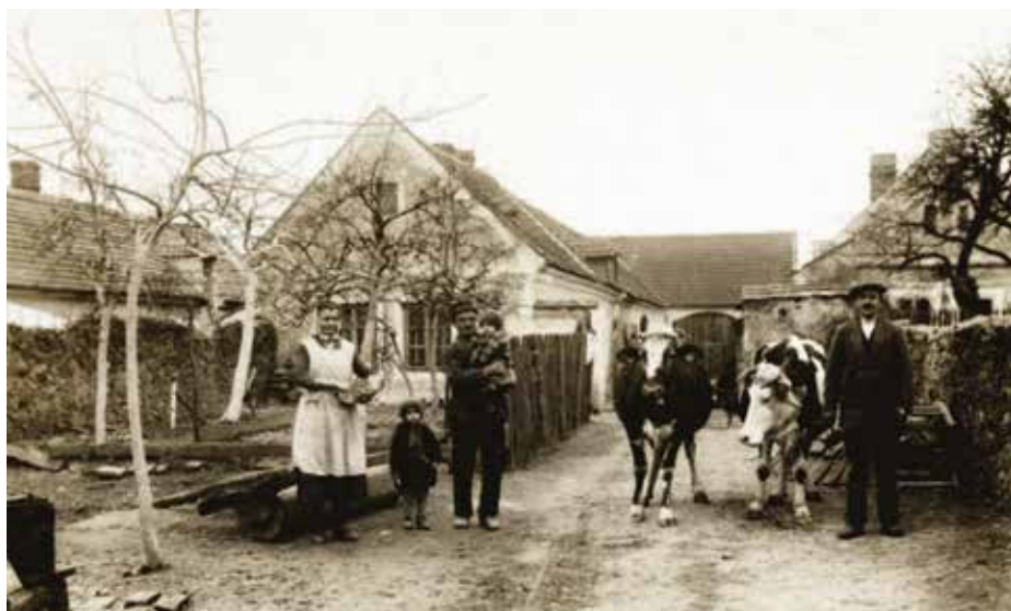
Újezd, padesátá léta