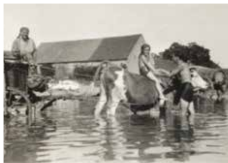
Sukovský rybník, 1950

Přicházel sem pokrok i tak, že byl zaveden telefon. Nejdříve k Poustkovům, do dvora a jedna linka do obchodu k veřejnému použití, jeden k Aronovi. Telefonovalo se tak, že po zatočení postranní klíčkou proběhlo spojení na průhonickou poštu a tam teprve spojovatelka propojila požadované číslo.