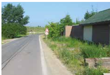
Formanská, Kateřinky – 2006

V dnešním čísle zpravodaje pokračujeme v představování míst z naší městské části, která v posledních letech dožila velkých změn.