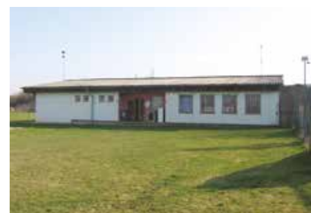
SK Újezd – 2007