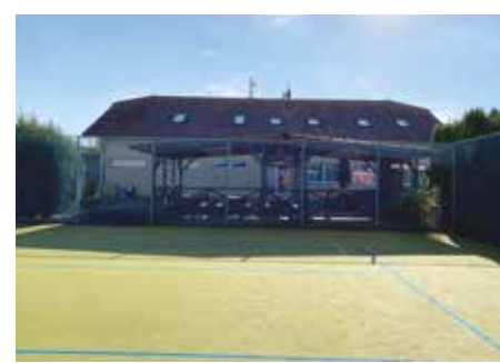
SK Újezd – 2022

I nadále bychom chtěli v této rubrice pokračovat, proto vás prosíme o zapůjčení vašich historických fotografií Újezdu nebo Kateřinek. Děkujeme.