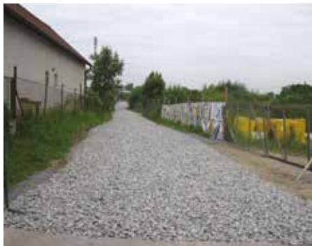
Újezd, ulice Nad Statkem – 2010