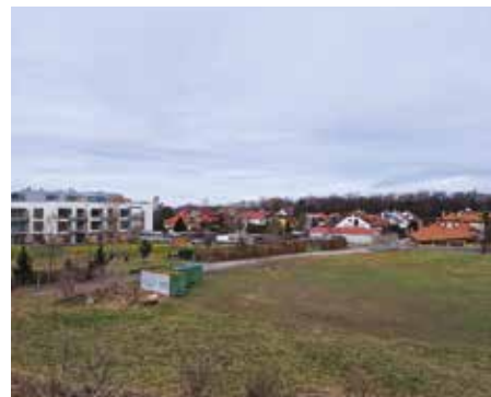
Kateřinky, úprava terénu u ulice Formanská – 2023

I nadále bychom chtěli v této rubrice pokračovat, proto vás prosíme o zapůjčení vašich historických fotografií Újezdu nebo Kateřinek. Děkujeme. Redakční rada (e-mail: info@praha-ujezd.cz ; tel: 272 690 692)