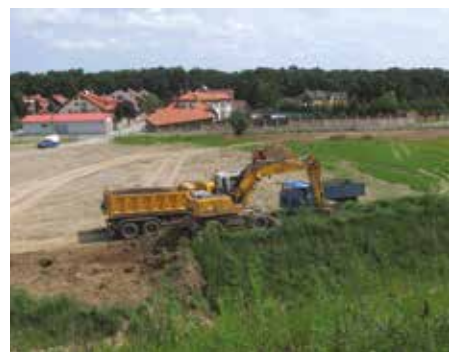
Kateřinky, úprava terénu u ulice Formanská – 2008