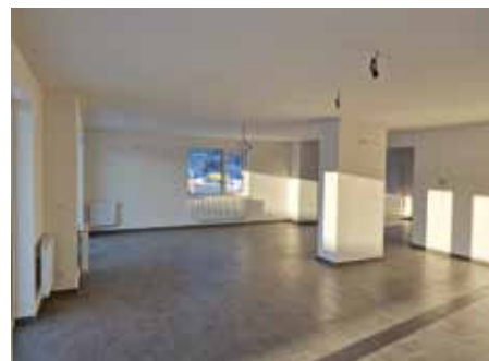
Nebytový prostor v ulici Pásteveců

Rozpočtové příjmy jsou tvořeny převážně přijatými transfery od hlavního města Prahy (21 881 000 Kč) a ze státního rozpočtu na výkon státní správy (118 200 Kč). Vlast-