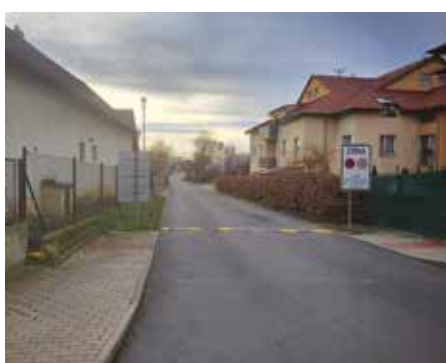
Újezd, ulice Nad Statkem – 2023