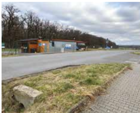
Kateřinky, ulice Formanská – 2023