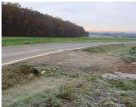
Kateřinky, ulice Formanská – 2004

V dnešním čísle zpravodaje pokračujeme v představování míst z naší městské části, která v posledních letech doznala velkých změn.