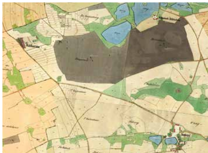
Újezd, Kateřinky, Milíčov a okolí na výřezu z tzv. císařského otisku stabilního katastru. Katastr vyznačen dodatečně editorem užitím světlejší barvy („slonová kost“)

Pokud ovšem připustíme starší dějiny osady Milíčova, stane se problematickým stáří Milíčovského lesa. Bylo přece běžné, že osadníci mýtili především nejbližší prostory kolem svých obydlí a dvorů. Využívali je jako pole a louky. Na druhé straně by bylo možné prodloužit stáří rybníků, alespoň některých. Srovnání mapy z doby 1. vojenského mapování po polovině 18. století ukazuje, že les byl již vcelku stejně rozlehlý jako dnes. Přístupný byl tehdy především cestou od Průhonic přes Újezd, která pak odbočovala k severovýchodu, aby později zamířila přímo k oboře a bažantnici. Procházela jí a mířila na sever za rybníky, kde stál dvorec. Kolem něj pokračovala k severovýchodu, k Hostivaří. Stabilní katastr z roku 1841 ale uvádí bažantnici pouze západně od této cesty, východním směrem jsou vyznačeny role. Zdá se, že toto mladší zobrazení více odpovídá původní rozloze lesa. Pokud tedy bude uvažováno o Milíčovském lese jako enklávě starého porostu, měla by se tím minit jeho západní část.