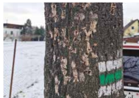
Napadený jasan v Milíčovské ulici

Jako sekundární škůdce do stromů nalétává lýkohub jasanový, který urychlí úhyn oslabeného jedince. U jasanů se následně objevují i další houbové patogeny (např. václavky), které napadají kořenový systém oslabených stromů. Z těchto jedinců se potom většinou stávají rizikové a havarijní stromy, protože mají v drtivé většině špatný