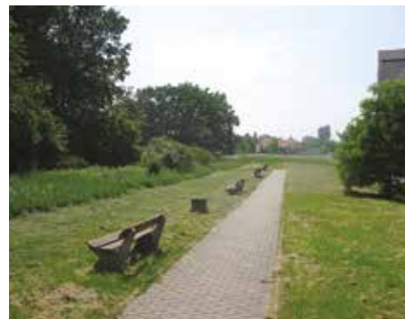
Vodnická, za věžáky – 2008