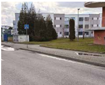
Formanská, Kateřinky – 2026