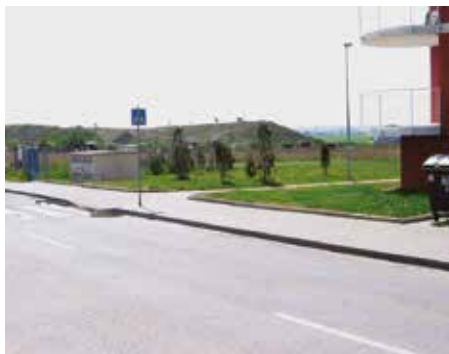
Formanská, Kateřinky – 2007

V dnešním čísle zpravodaje se vracíme k představování míst z naší městské části, která v posledních letech doznala velkých změn.