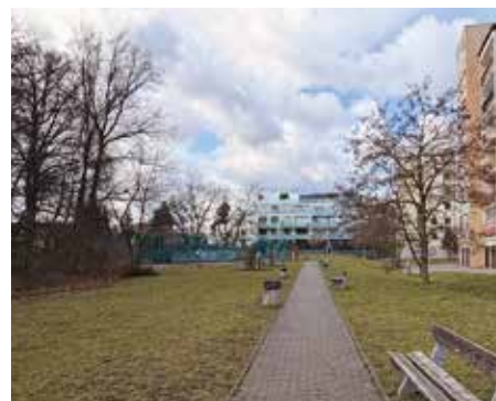
Vodnická, za věžáky – 2026