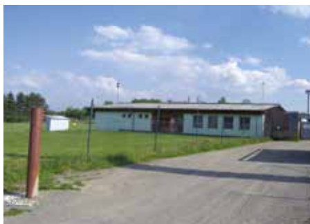
Ulice Nad Statkem – 2008