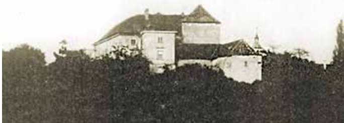
Zámek v Průhonicích, staleté sídlo vrchnosti pro Újezd a Kateřinky, jak vypadal před romantickou přestavbou v závěru 19. století.

lidi ze své části jiného Újezdu, který se tenkrát rozkládal na území dnešní Prahy okolo dodnes dochovaného kostela sv. Martina ve zdi. Dominikánky by nebyly při uplatnění takového postupu první. Sám český panovník dal dávno předtím převést původní obyvatelstvo Malé Strany do Hostovic a uvolněné území nechal znovu kolonizovat na organizovaném základě.