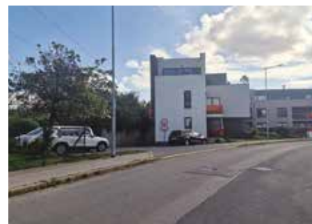
Ulice Proutěná – 2026