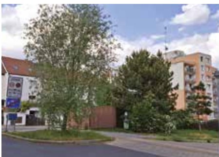
Ulice Na Křtině – 2026