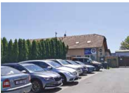
Ulice Nad Statkem – 2026