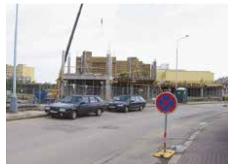
Ulice Proutěná – 2007