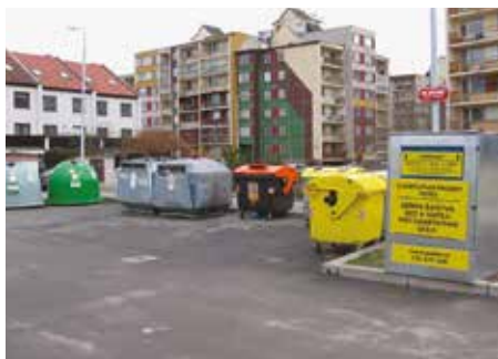
Ulice Na Křtině – 2008

V dnešním čísle zpravodaje pokračujeme v představování míst z naší městské části, která v posledních letech dožila velkých změn.